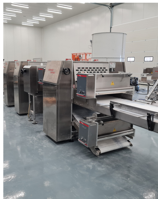
NOVI POGON ZA FRIGO I PITE