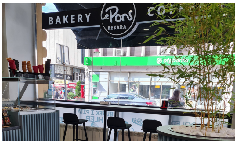
LE PONS COFFEE & BAKERY 2021.

U OKVIRU PREMIUM COFFEE&BAKERY KONCEPTA TRENUTNO RADE: