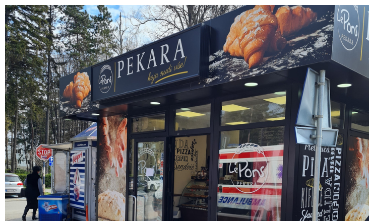
DANAS LE PONS PEKARA NA ISTOJ LOKACIJI, U FORMATU KIOSKA