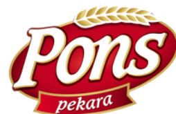
PONS LOGO NEKAD I SAD