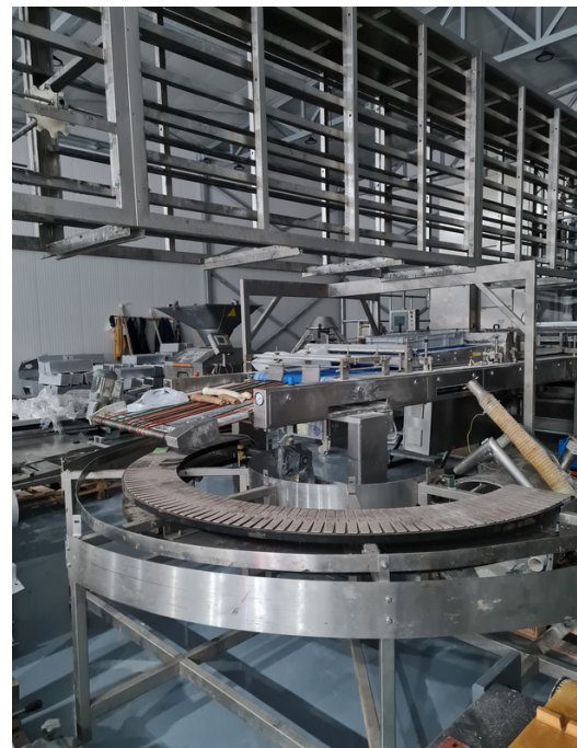
NOVI POGON ZA POLUPEČENE HLEBOVE