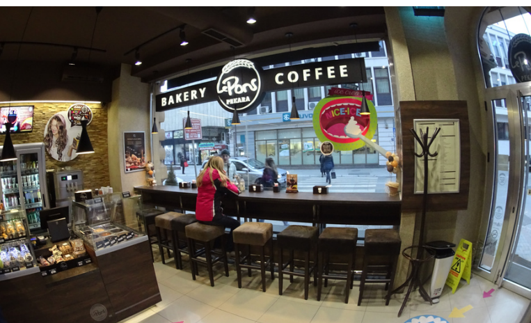
LE PONS COFFEE & BAKERY 2015.

Kada je 2015. godine otvoren prvi premium Coffee & Bakery maloprodajni objekat u Čačku, pekara Pons je u svom lancu pekara imala 27 otvorenih objekata. Njihov asortiman su pretežno činili hlebovi i dnevna peciva. Međutim, otvaranjem Le Pons pekare u ulici Župana Stracimira broj 17, započeli smo razvoj naših maloprodajnih objekata u potpuno novom smeru. Danas se u premium objektima, pored standardnog asortimana, mogu pronaći i artikli poput sladoleda, burgera, pomfrita, kafe i drugih proizvoda, a naši pizza majstori zaduženi su za pripremu posebno ukusnih Pizza.