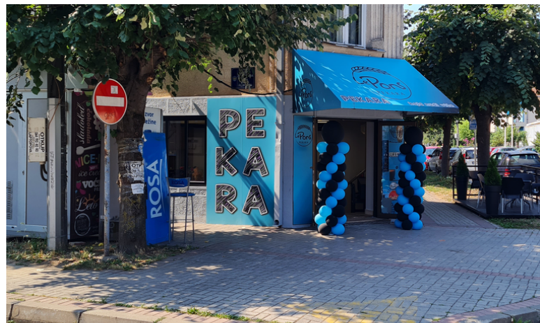
LE PONS, KRALJA PETRA I 14, ČAČAK