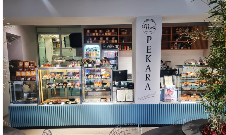
LE PONS COFFEE & BAKERY, GORNJI MILANOVAC