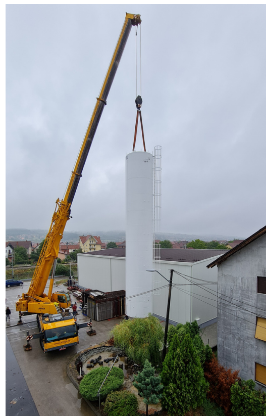
POSTAVLJANJE SILOSA, AVGUST 2021.