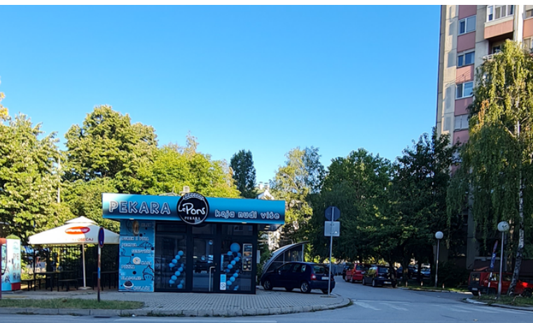
LE PONS, BULEVAR OSLOBOĐENJA BB, ČAČAK