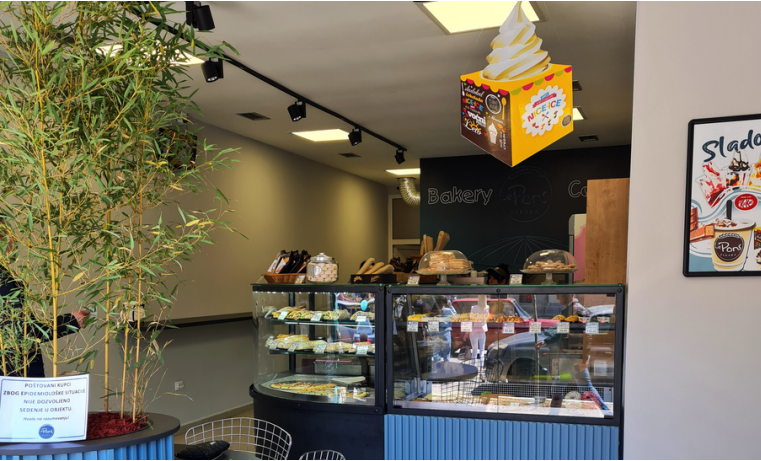
LE PONS COFFEE & BAKERY, KRAGUJEVAC