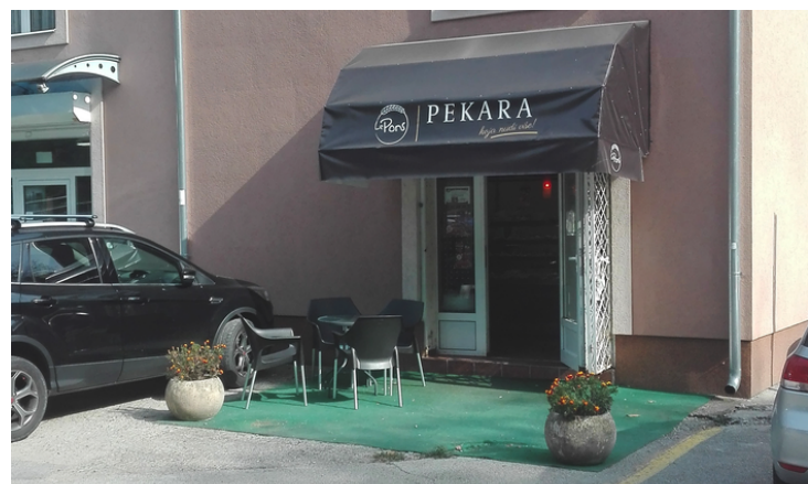
PRVI MALOPRODAJNI OBJEKAT, OTVOREN 2007.

Godine 2007. pekara Pons je otvorila prvi maloprodajni objekat u Čačku, u ulici Veselina Milikića broj 7. Tada smo krenuli sa potpuno novim vidom poslovanja, koji nam je do tada bio nepoznat. Danas u okviru naše kompanije posluje 37 maloprodajnih objekata, koji rade u formatima pekare i premium Coffee&Bakery objekata.