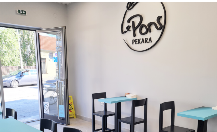
LE PONS, MILENKA NIKŠIĆA 7, ČAČAK