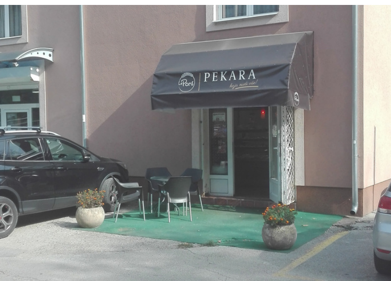
PRVI MALOPRODAJNI OBJEKAT, OTVOREN 2007.

Za razliku od klasičnih pekara, premium koncept podrazumeva i daleko raznovrsniji asortiman , pa tako pored dnevno svežih peciva, u Le Pons Coffee & Bakery formatima možete pronaći burgere, pizzu, pomfrit, kafu, sladoled i druge netipične pekarske artikle.