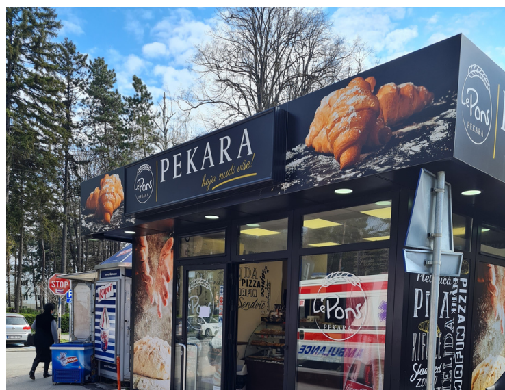
DANAS LE PONS PEKARA NA ISTOJ LOKACIJI, U FORMATU KIOSKA