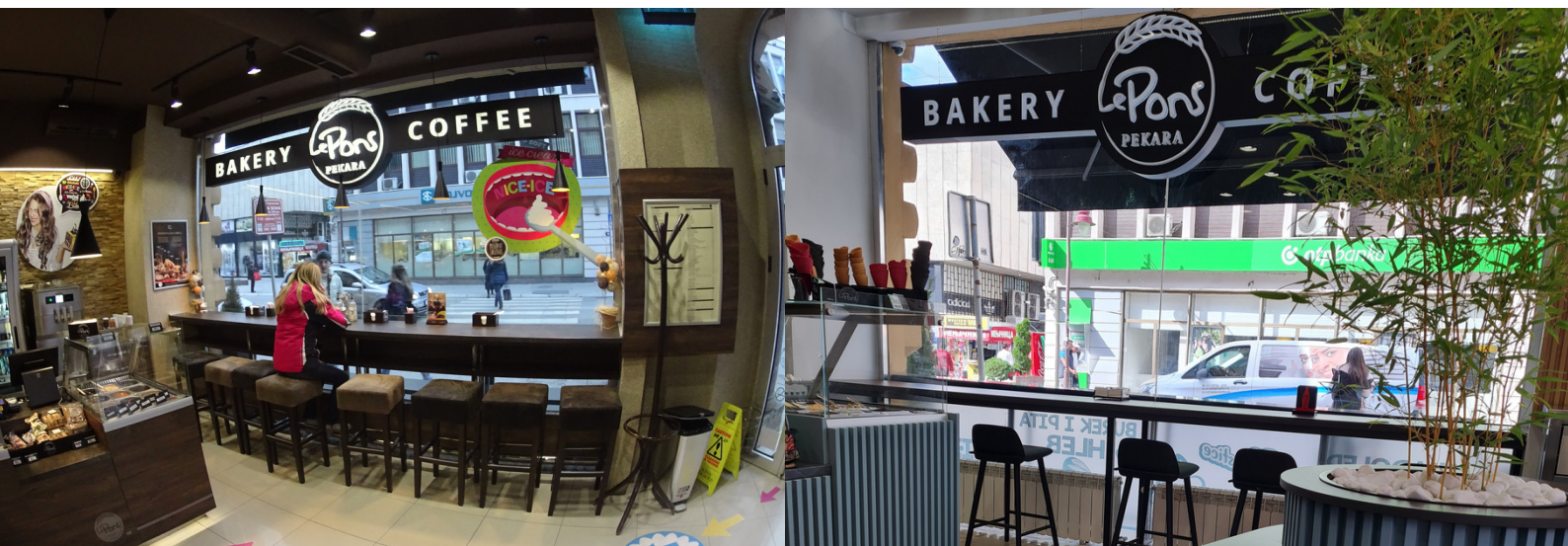
LE PONS COFFEE & BAKERY 2015.